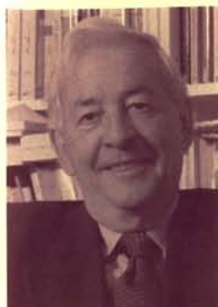
Jacques Lacoursière historien.

Découvrez l'histoire de la région Est de l'Estrie avec Jacques Lacoursière, historien et communicateur de grande réputation.