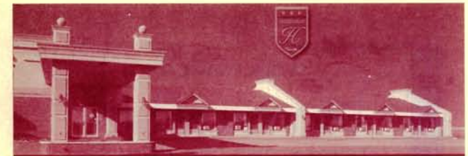
La Maison du Granit